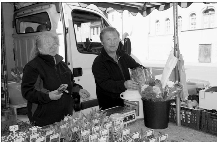
Große Nachfrage gab es am Blumen- und Gemüsestand der Fa. Sporbert.