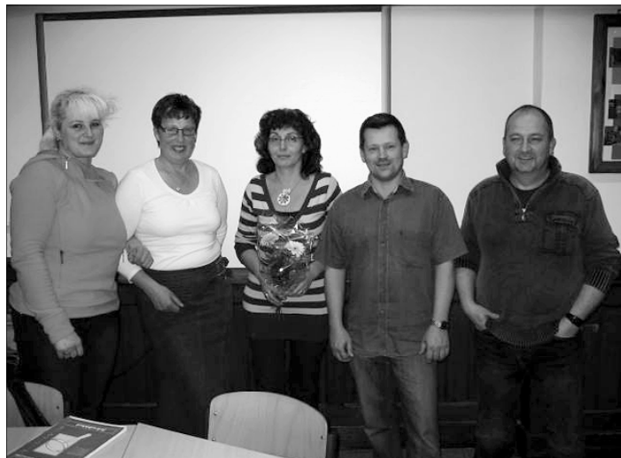
Die Mitglieder des neuen Vorstandes.

Besonders wichtig ist die Verstärkung des Vereins durch weitere interessierte Eltern und Bürger.