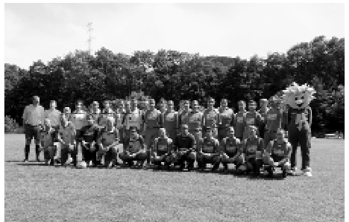
SG Gräfenenthal/Lichte und die Traditionsmannschaft des FCCZ

Rund 400 zahlende Gäste aus der ganzen Umgebung bejubelten und beklatschten alsdann das spannende Spiel der SG Gräfen-