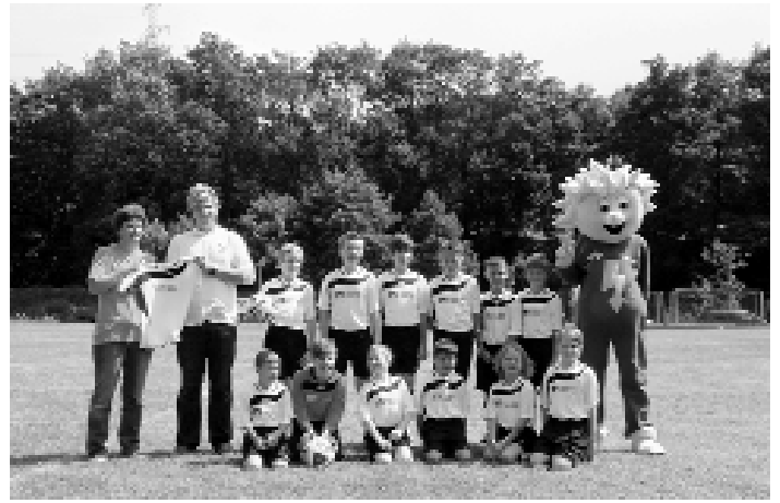
Trikotübergabe der Volksbank Saaletal eG