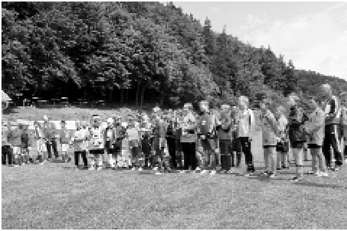
Jugendturnier „Pokal des Bürgermeisters“