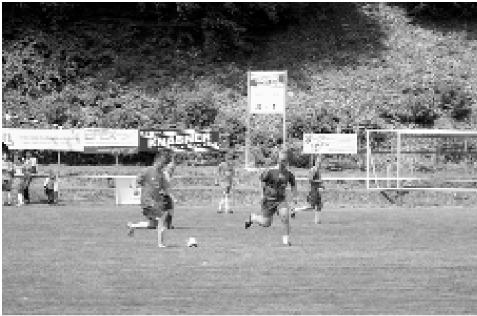
Spiel „Alte Herren“ gegen Volksbank