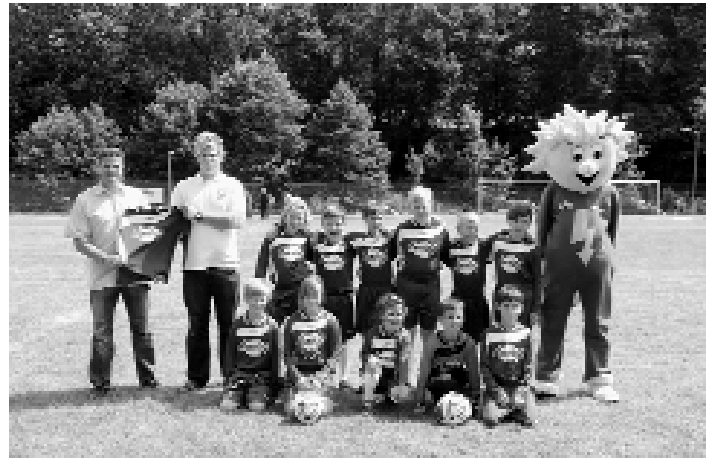
Trikotübergabe von enviaM

Ab 15.00 Uhr – als der Höhepunkt unseres Wochenendes angesetzt war – hatte dann Petrus endlich ein Einsehen und sorgte für trockenes Wetter und Sonnenschein.