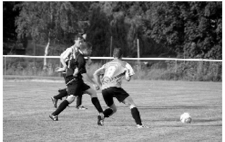
Freundschaftsspiel gegen Hirschfeld

Das Wochenende begann bereits am Freitag mit einem Freundschaftsspiel des 1. FC Hirschfeld gegen die SG Gräfenenthal/Lichte.