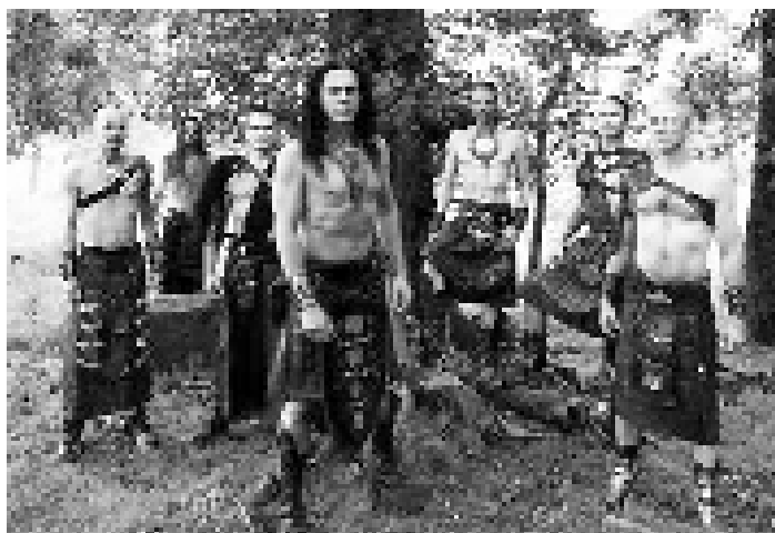
Die Könige der Spielleute „Corvus Corax“.

Umfangreiche behördliche Auflagen sind zu erfüllen, technische und logistische Aufgaben zu lösen und aufwändige verkehrstechnische Maßnahmen einzurichten.