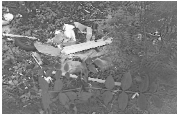
Deponie Hühloch Lichtenhain, Gräfenenthal