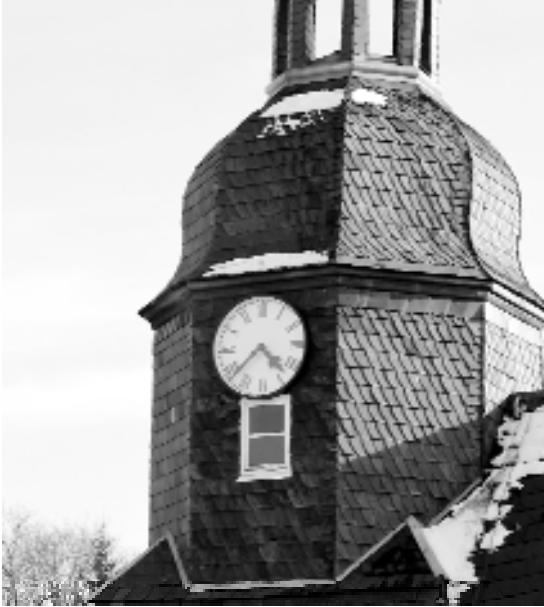
Die neue Turmuhr