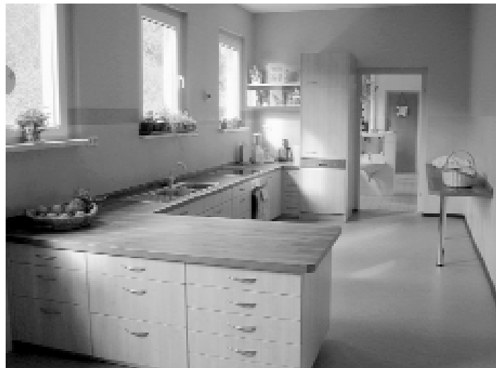
Unsere neue Kinderküche.

Dieses Projekt lag uns schon seit längerer Zeit am Herzen und konnte nun Dank großzügiger Sponsoren und dem Erhalt von Lottomitteln – welchen uns der Landtagsabgeordnete Maik Kowallek vermittelt hat – verwirklicht werden.