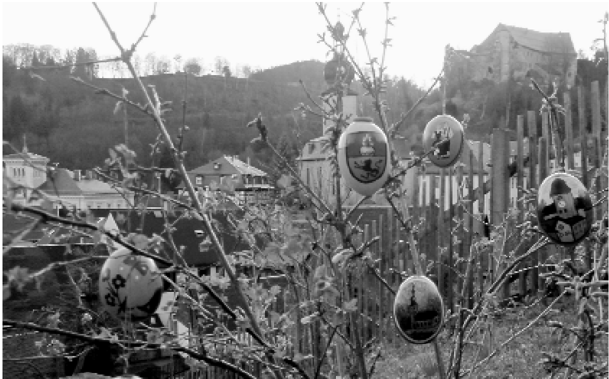
Handgemalter Osterschmuck zum Festjahr 2012 – gestaltet von M. Kosater.