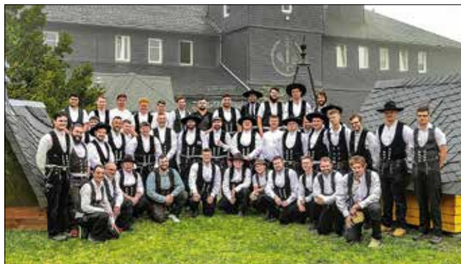
Teilnehmer der Meisterprüfung Teil 1+2

In einer Zeit, in der handwerkliche Berufe mehr denn je gefragt sind, gibt es außerdem einen neuen Grund zur Freude. In diesem Jahr öffnet der neue Klempnermeisterkurs erstmals seine Tore. Sichert euch jetzt einen Platz und werdet zum Meister eures Fachs! Für genauere Informationen gerne mit uns Kontakt aufnehmen.