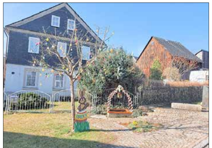
Bild zeigt Osterbrunnen und Osterbäumchen Röttersdorf

In unseren Ortsteilen und in Lehesten fanden sich wieder viele Freiwillige, die die Osterbrunnen oder Osterdekoration in den Ortschaften gestalteten. Damit wurde überall ein bunter Blickfang geschaffen, der an Ostern mit seiner Botschaft des Neuanfangs, der Freude, des Glaubens und der Liebe erinnert. Vielen Dank dafür!