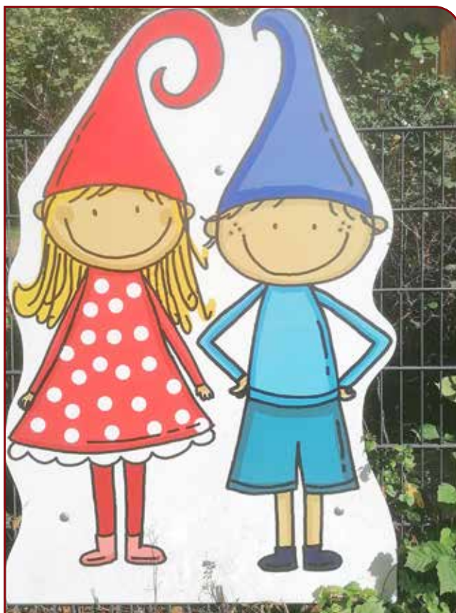
„Kleine Strolche“ am Haupteingang - neues Logo