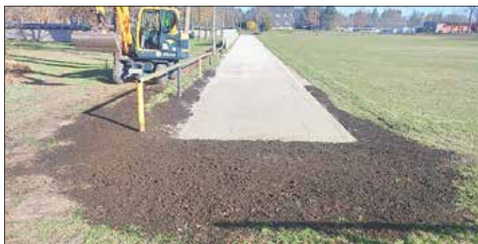
Bild zeigt Laufbahn nach Fertigstellung

Vielen Dank an den Bauhof Lehesten für die ausdauernde und gute Arbeit.