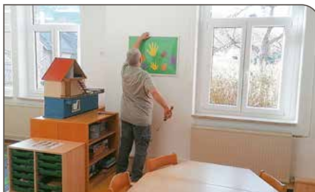
Neue Fenster im Kindergarten