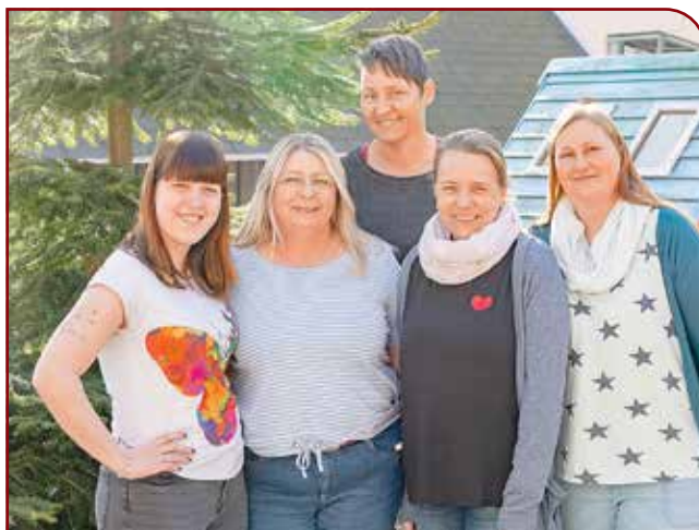
Das Erzieherinnen-Team des Kindergartens