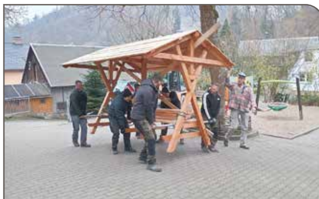
Anlieferung der Rehraufe durch Anwohner aus Pippelsdorf, Königsthal und Markt-gölitz