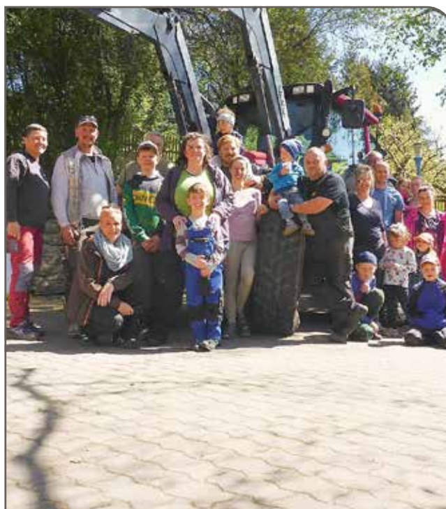
Helfer und Traktor beim Arbeitseinsatz 04/2024