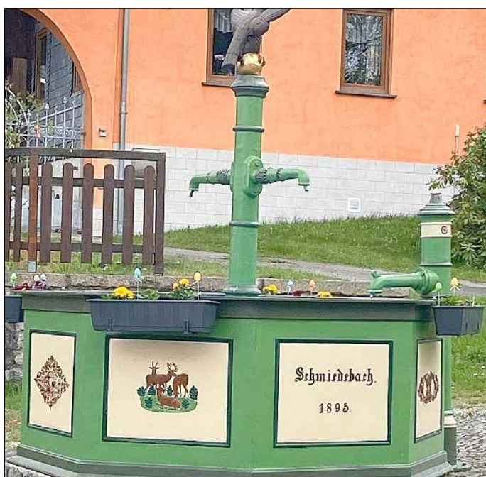
Bild zeigt den österlich geschmückten Brunnen aus Schmiedebach

Fertigstellung der Laufbahn auf dem Sportplatz Lehesten Nach der winterbedingten Pause konnte vom Bauhof Lehesten die Laufbahn auf dem Sportplatz Lehesten fertiggestellt werden. Damit ist die Baumaßnahme Sprunggrube mit Anlaufbahn und Laufbahn beendet.