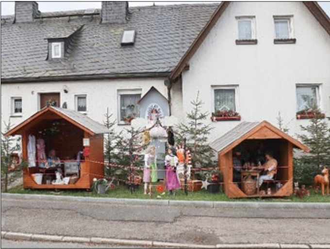
Beispielfoto der Ausstellung

Am 17.01.2025 wurde nochmals eine unerlaubte Müllablagerung im Container des Friedhofes Lehesten festgestellt. Dieser Müll wurde durch den Bauhof der Stadt Lehesten entsorgt. Hierdurch entstehen der Stadt Lehesten Mehrkosten für die Müllentsorgung, die alle Bürgerinnen und Bürger der Stadt Lehesten tragen müssen. Es gibt derzeit keine Hinweise auf eine Person, die den Müll unerlaubt entsorgt haben könnte. Haben Sie Hinweise, so teilen Sie diese bitte unseren Kontaktbereichsbeamten mit oder nutzen Sie die Sprechzeiten des Bürgerbüros im Rathaus, um Ihre Hinweise abzugeben. Vielen Dank!