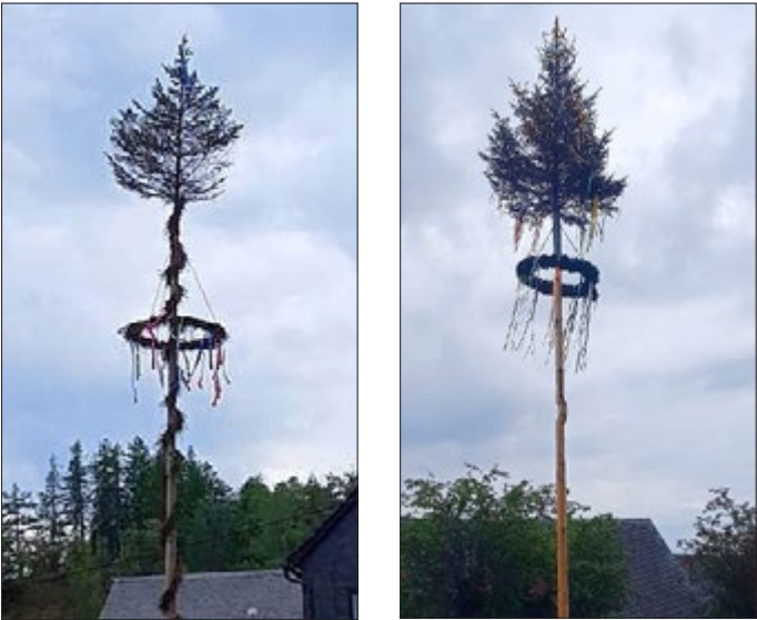
Fotos zeigen die Maibäume der Stadt Lehesten und ihren Ortsteilen.

Die Wahl des Stadtbrandmeisters wird bis Neuerstellung der Satzung über die Freiwilligen Feuerwehren der Stadt Lehesten verschoben.