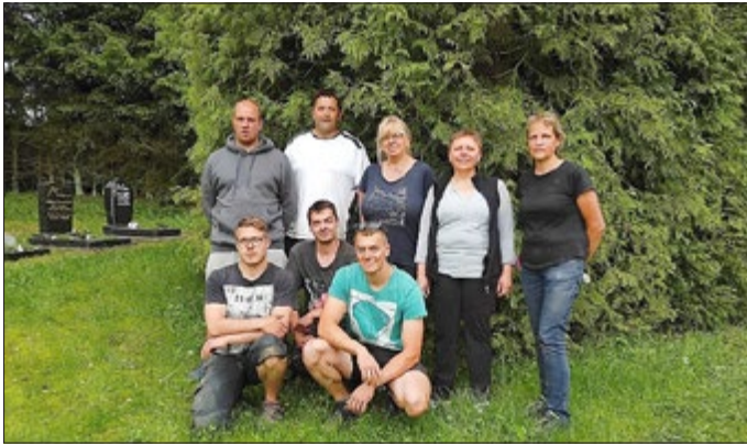
Die „Grüne Wiese“ und das Röttersdorfer Einsatz-Team.