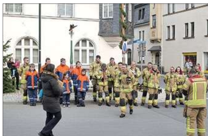
Vornahme von Beförderungen von Kameraden der Feuerwehr; Foto: Chr. Vockeroth

Mit einem Lampion-Umzug zum Luna-Park wurde das Aufstellen des Maibaumes beendet und im Luna-Park begann die Walpurgisnacht mit einem Maifeuer, musikalischer Umrahmung und der Versorgung der Gäste - in Organisation des KCL.