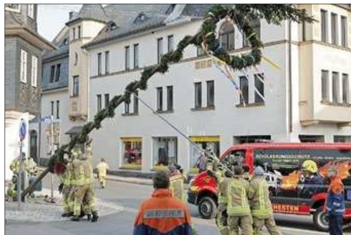
Der Maibaum wird aufgestellt.

Ihnen wünsche ich für Ihren weiteren Weg bei der Feuerwehr alles Gute. Allen Kameraden und Kameradinnen der Feuerwehr danke ich an dieser Stelle für ihre Einsatzbereitschaft und ihr ehrenamtliches Engagement.